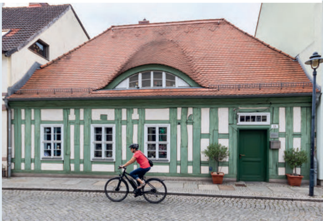
links: das Haus Ehm-Welk-Str. 24 vor der Sanierung